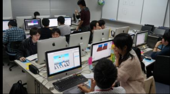
最後の追い込みです