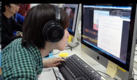
いよいよサウンドにも着手